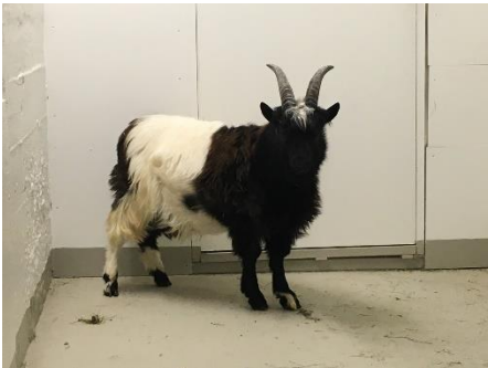
Frey móður 19-998