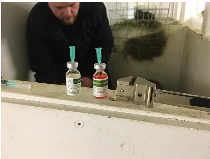
Mynd 3 Verið að berklaprófa, Þorvaldur Þorbjörnsson er Hörpu dýralækni til aðstoðar.